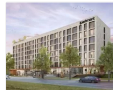
iPartment: für Arbeits- und Faultiere

Noch kein Kommentar, Füge deine Stimme unten hinzu!