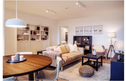
So stellt sich VWI den Wohnbereich im Projekt Lindenhöfe, der Teil des zweiten Bauabschnitts ist, vor.