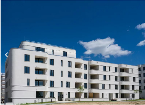
Außenansicht eines Wohngebäudes im zweiten Bauabschnitt.

VW verfügt über langjährige Erfahrung im Bereich des Mitarbeiterwohnens. Denn bereits vor der Gründung eines Tochterunternehmens mit Immobilienbezug, errichtete die Firma ab den 1950er-Jahren Wohngebäude. Teilweise leben Mitarbeiter schon seit 50 oder 60 Jahren zur Miete bei ihrem Arbeitgeber. Dabei übernimmt VWI die Rolle des Bauherrenvertreters und Projektsteuerers für die Bereiche Bauleitplanung, Baurechtschaffung, Infrastrukturplanung, sowie für alle Leistungsphasen der Neubauprojekte und Sanierungs- und Instandhaltungsmaßnahmen. Zudem zeichnet VWI für die Projektentwicklung, Baustellenlogistik, Gewährleistungsmanagement, Schadstoffmanagement und Nachhaltigkeitsthemen verantwortlich. Für das Großprojekt Steimker Gärten arbeitet der Konzern mit externen Investoren zusammen.