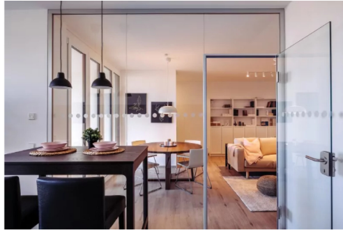
Eine Musterwohnung in jenem Neubau.