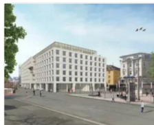
Basecamp Dortmund: Der Mix macht's