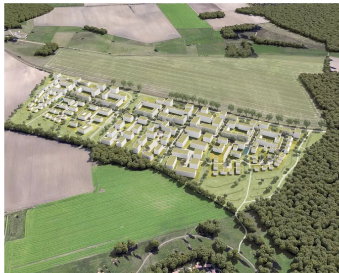
Mit den Steimker Gärten entwickelt VWI einen eigenen Stadtteil von Wolfsburg.

Der Automobilhersteller Volkswagen (VW) und die Stadt Wolfsburg gehören zusammen wie Tulpen und Holland, Käse und die Schweiz oder Fische und Wasser. VW ist der größte Arbeitgeber in der Stadt und viele Zulieferer haben sich hier angesiedelt, sodass die Automobilindustrie den bedeutendsten Wirtschaftsfaktor der Region ausmacht. Damit gehen eine gewisse Verantwortung aber auch ein positives Image von VW für Wolfsburg einher, derer sich das Unternehmen nur allzu bewusst ist. Nur, wenn sich die Stadt auch abgesehen von den Automobilwerken als attraktiver Wohnraum präsentiert, wollen Fachkräfte hierherziehen. Denn irgendwann beginnt der Feierabend und was fängt man damit an, wenn es keine Wohnungen, keine Einkaufsmöglichkeiten und keine Kulturangebote gibt? Es bedarf also neuer Stadtviertel, die den Ansprüchen der gut ausgebildeten Zielgruppe gerecht wird, damit sie sich dort wohl fühlt und eine Verbindung zur Nachbarschaft und im Idealfall auch zum Arbeitgeber aufbaut.