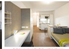
Studenten-Apartment Bild Objekt und Küche Micrositing