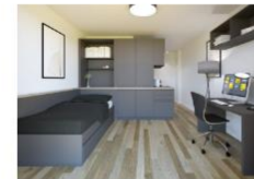
Business-Apartment Bild Objekt und Küche Micrositing

Die Konzeption und Planung müssen das rechtzeitig berücksichtigen, um so frühzeitig Kosten zu sparen. Dadurch, dass die gemeinsame bedarfs- und budgetgerechte Beratung und Planung im Fokus unserer Arbeit steht, werden Ressourcen frei für hochwertige Qualität. Denn Wohnatmosphäre entsteht durch eine wertige und praktische Einrichtung. Und wenn die stimmt, dann werden die Bewohner möglichst während der gesamten Zeit des Aufenthalts in einer neuen Stadt an das Objekt gebunden. Somit profitieren alle Kunden von der gebündelten und zielgerichteten Kompetenz aus beiden Bereichen.